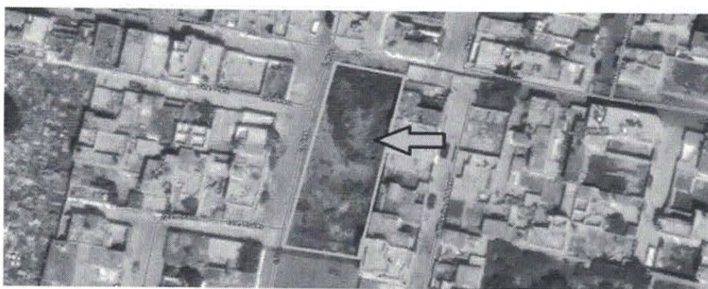
Predio señalado ubicado en calle Plata, sin número, Colonia El Arenal II, C.P.56370, Chicoloapan Estado de México.

Segundo. Con fundamento en los artículos 53 fracción II y 186 segundo párrafo de la Ley de Transparencia y Acceso a la Información Pública del Estado de México y Municipios, la Unidad de Transparencia turnó al Servidor Público Habilitado, Titular de Catastro , de este Sujeto Obligado; Ayuntamiento de Chicoloapan, el oficio respectivo a efecto de que en el ejercicio de sus funciones y atribuciones brindara respuesta a la Solicitud de Información en comento. -----